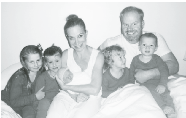
Țintuit la pat cu copiii.

trezit într-o stare asemănătoare. Prin urmare, am organizat un Maraton anual al Somnului prin care să ajut la strângerea de fonduri pentru cercetare. Dacă ți-ar plăcea să mă sponsorizezi, și eu sunt convins că ți-ar plăcea, te rog să donezi 100 de dolari pentru fiecare oră pe care o dorm. Tu vei face un mare serviciu umanitar iar eu voi fi un tată mai bun, mulțumită bunătății și sprijinului tău. Este o situație din care toată lumea câștigă. Îmi dau seama că asta lasă impresia că tu n-ai face decât să mă plătești pe mine ca să dorm, dar este mai mult de atât. Împreună, noi putem face ca acțiunea de a avea copii să fie mult mai suportabilă. Mă rog, mai suportabilă pentru mine și pentru contul meu bancar. Îți mulțumesc pentru generozitatea ta.